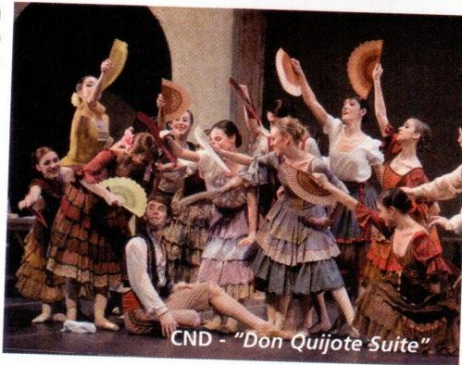
CND - "Don Quijote Suite"

Además, el aclamado pianista londinense James Rhodes (1/VII) ofrece un recital con obras de Bach y Chopin, entre otros.